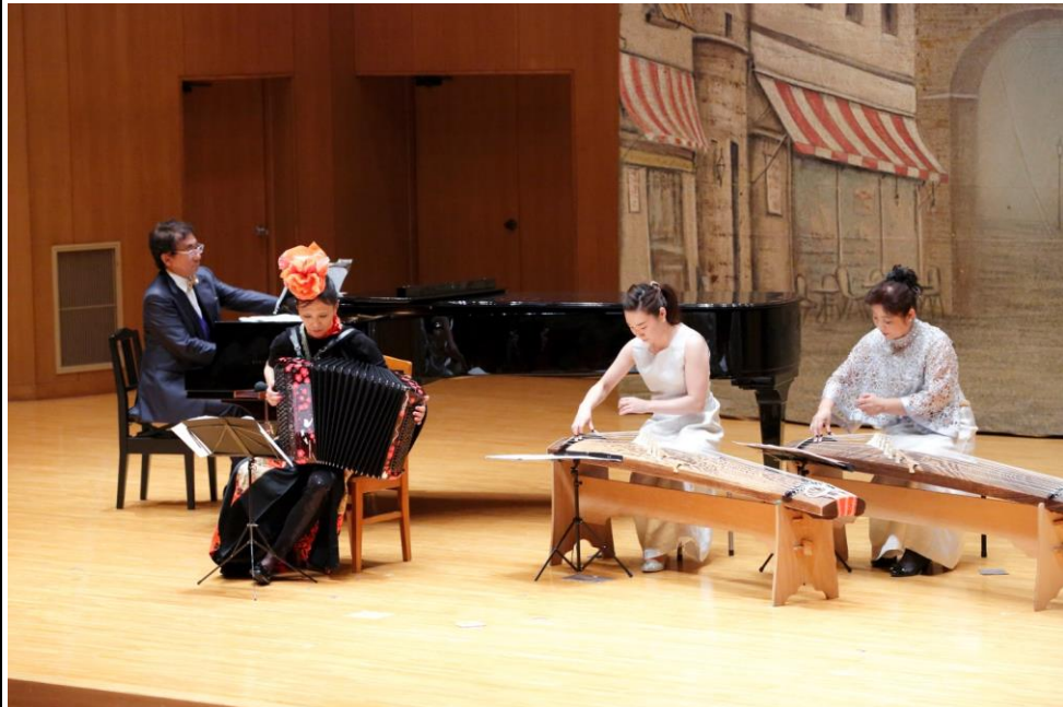
演奏会当日の様子1

音楽の表現幅をさらに拡大し、栃木県の音楽文化の発展に尽力、アピールを今後も積極的に行っていきたい。